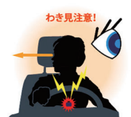
わき見運転を感知